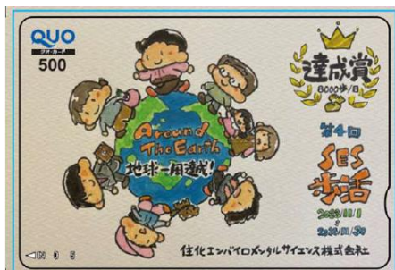
社員イラスト入りオリジナルクオカード

「ウォーキング効果upセミナー」等のフィジカルヘルスに特化したセミナーを開催し、イベント参加率や「平均歩数8,000歩/日」達成者率の向上、運動習慣の定着をめざしています。