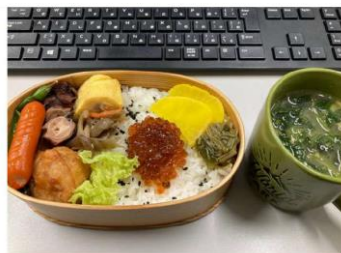
今日のお弁当。特の野菜はとくに多く、栄養満点です。表示数を減らす