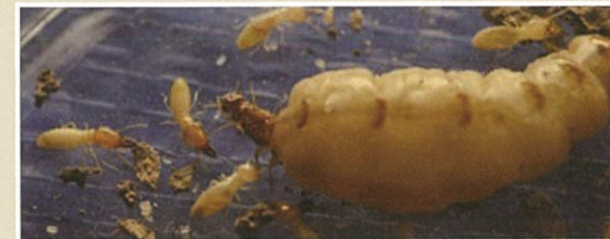
イエシロアリ(女王、働きアリ、兵隊アリ)

日本で建築物に大きな被害を与えるのはイエシロアリとヤマトシロアリの2種類です。前者は6月~7月の夕方頃に、後者はゴールデンウィーク前後の日中に羽アリが群飛します。これらのシロアリは湿気を好むため、浴室、台所、洗面所の土台、敷居、床組などあるいは雨漏りのある所が被害をよく受けます。さらにイエシロアリは巨大なコロニーを造ることができるので屋根裏まで被害が広がる可能性があります。