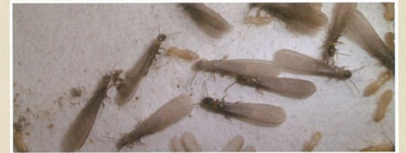
ヤマトシロアリ(羽アリ、働きアリ、兵隊アリ)